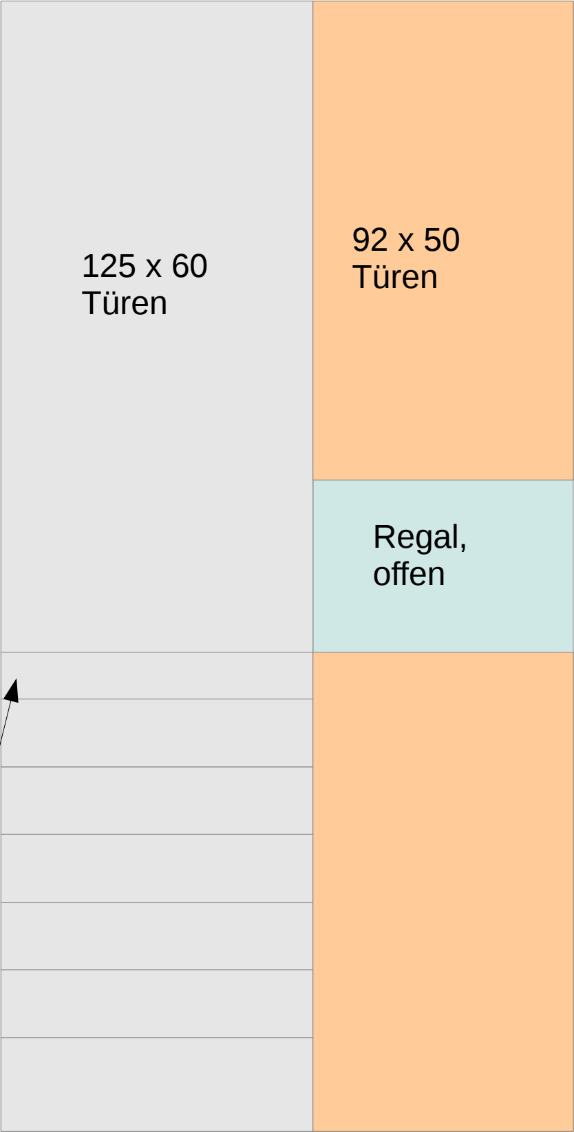
Extraflacher Schubkasten, mit 9,4er Blende